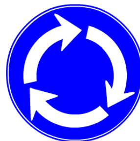
環状交差点の道路標識