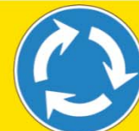
〔新設される道路標識〕