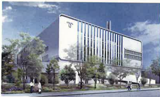
新しいクリーンセンターの完成予想図