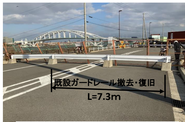
(既設ガードレール撤去・復旧②)