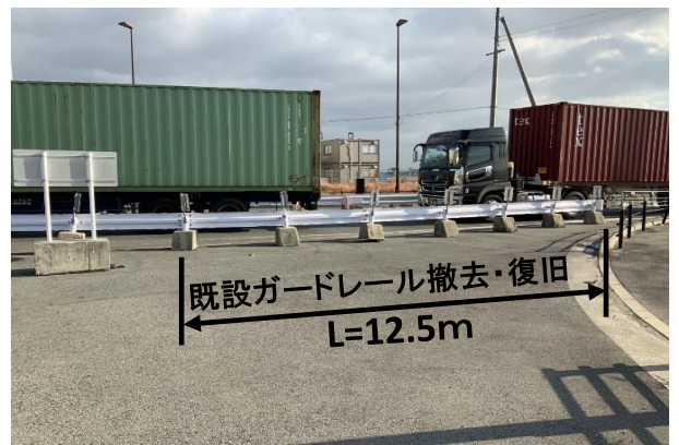
(既設ガードレール撤去・復旧①)