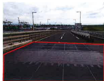
補修箇所写真 (伸縮装置)